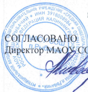
График реализации программ, реализуемым на базе Центра «Точка роста» в 2023-2024 уч. году